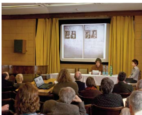
Sympozium Zločin a trest v české kultuře 19. století ve Studijní a vědecké knihovně Plzeňského kraje.

Několik příspěvků na sympoziu pocházelo od historiků umění a týkalo se bezprostředně umělecko-historické problematiky: Tomáš Winter – Dokumentace zločinců jako umělecký princip, Pavla