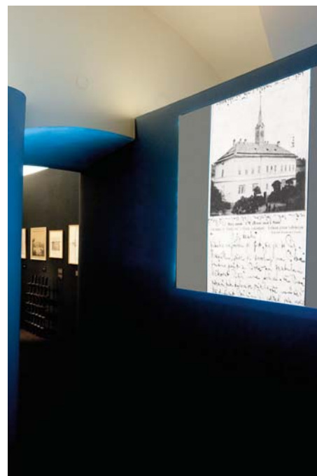
Výstava Vražedná realita: Zločin a trest v českém výtvarném umění 19. století v Západocheské galerii v Plzni.

Redakční radu svolává obvyklou komunikační formou zpravidla dva týdny pře-