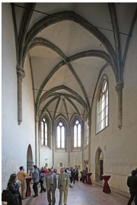
Kolokvium o Karlu Škrétovi v Anežském klášteře v Praze, kaple