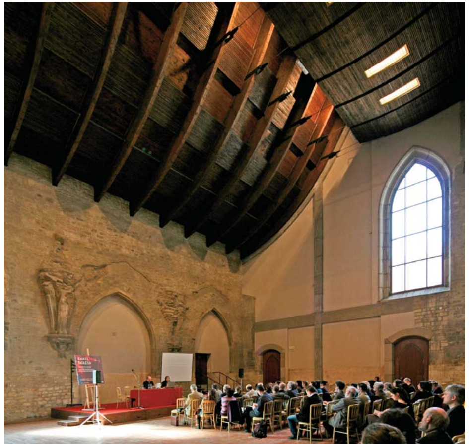
Kolokvium o Karlu Škrétovi v Anežském klášteře v Praze

Pozvánka na valnou hromadu UHS Návrh nového znění stanov a jednacího a organizačního řádu UHS Uskutečněná a chystaná odborná setkání O galerii tentokrát z galerie Usnesení RIHA Personalalia