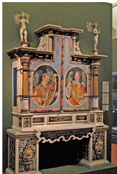
Výstava o umění reformace na Pražském hradě, část expozice umění v severních Čechách