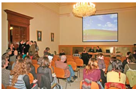
Konference o umění reformace v Akademii věd v Praze

Ve dnech 17.–19. února tohoto roku uspořádal Ústav dějin umění AV ČR konferenci Umění reformace v českých zemích (1380–1620). Setkání mělo překvapivý ohlas – již první den zaplnilo jednací sál v budově Akademie věd na Národní třídě téměř 100 lidí a pozoruhodné bylo, že tento zájem vytrval až do posledního dne a hodiny jednání. Konference měla široký ohlas i mezi ostatními vědními disciplínami, mezi přednášejícími i v řadách publika byli vedle uměleckých historiků také historikové, památkáři, knihovníci, liturgikové i archeologové, zabývající se reformační kulturou pozdního středověku a raného novověku. K popularitě tématu a nebyvalé návštěvnosti jistě přispěla tematická výstava Umění české reformace (1380–1620), která nedávno skončila v Císařské konírně na Pražském hradě. Není tedy divu, že velmi cennou součástí konference byly živé debaty v kuloárech v přestávkách mezi jednotlivými bloky.