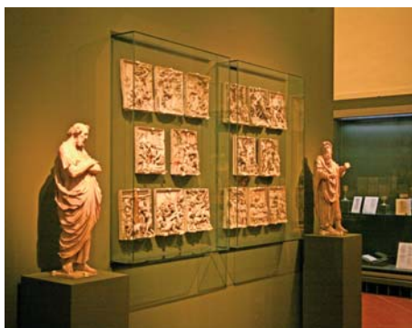
Výstava o umění reformace na Pražském hradě, část expozice umění v severních Čechách